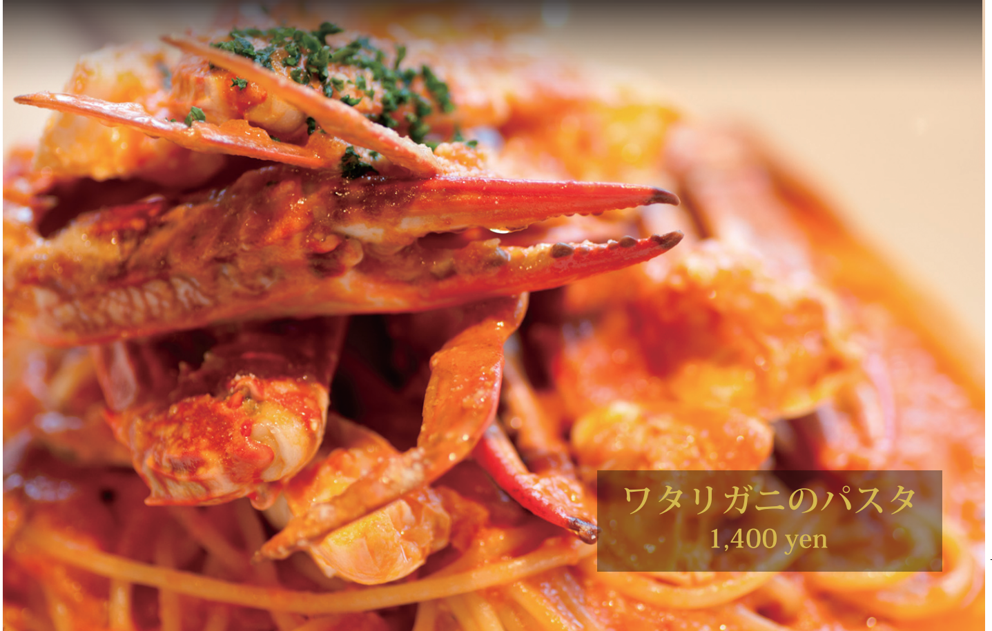
ワタリガニのパスタ 1,400 yen