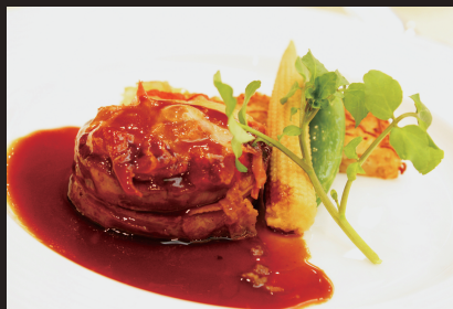
有機大豆のハンバーグ 1,200 yen