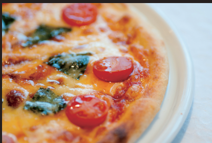
秋味の石窯ピザ 1,600 yen